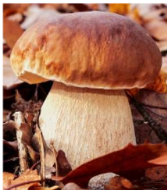
JESENSKI GOBAN (JURČEK)