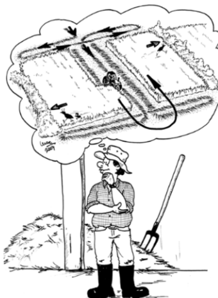
Za živali neustrezen (levo) in ustrezen tip košnje (desno).